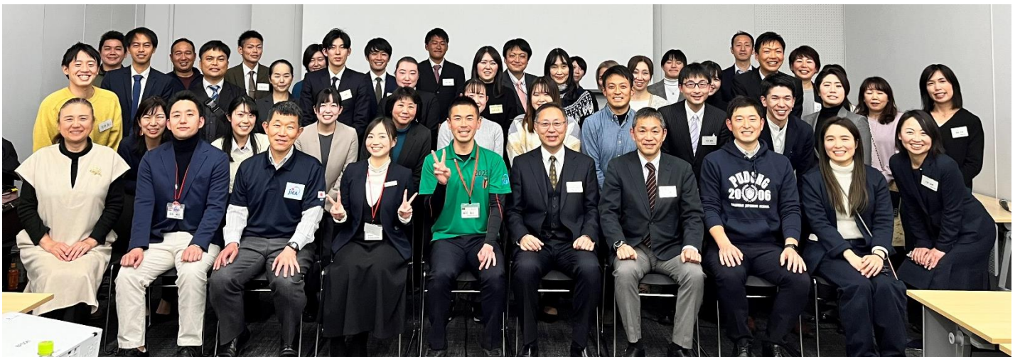
参加者全員での記念撮影

していただきました。日本人学校とは異なった目的を持ち、違う視点から現地を見た報告から多くのことを学んだ1日となりました。