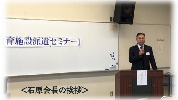
育施設派遣セミナー